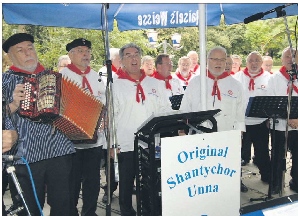
Der Shantychor bei seinem jüngsten Auftritt im Kurpark. Als nächstes singen die Mitglieder im Bürgerhaus Massen. Im November musizieren sie zugunsten der Seenotretter.